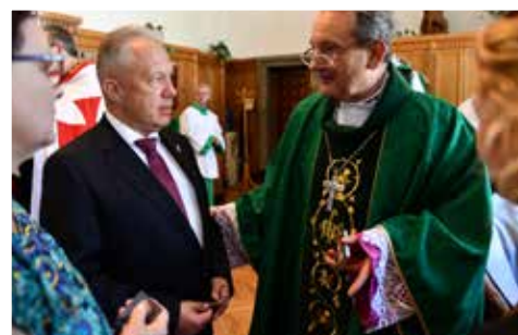
NIEPOKALANÓW - MSZA ŚWIĘTA W BAZYLICE MNIEJSZEJ