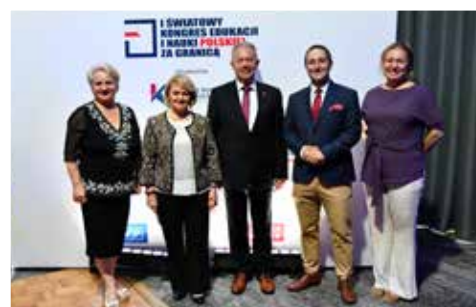
UROCZYSTA KOLACJA NA ZAKOŃCZENIE KONGRESU